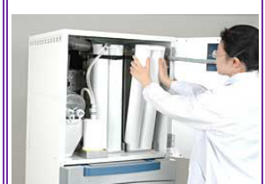
離子交換樹脂容易更換