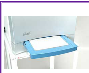
節省空間的採水盤