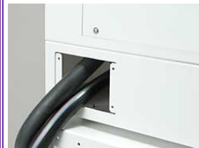
供水・排水口可左右設置